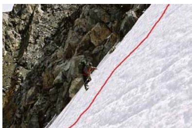
Bod 6.: do sedla Delane pass

Výstup do sedla (6) začíná trhlinou. Potom cca 250 metrů lezení v ledu na vrchol. Klienti horských vůdců to mají na levé straně vyfixovaný. Je nutnost mít nějaké zkušenosti s lezením v ledu, jištěním a šandováním. Mapa udává obtížnost 2B v Ruské stupnici. Sklon ledu je cca 50°.