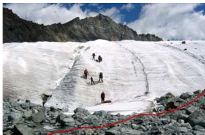
Bod 5.: ledovec u Tomskie stojanki