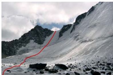
Bod 6.: sedlo Delane pass

Čelo ledovce (5) je vidět ze stanu. Podle mapy se stále jedná o ledovec Akkem. Horští vůdce zde učí klienty lezení v ledu. Ledovec se obchází zprava, jde to i přímo přes něj, ale je to zbytečný. Po chvíli se na něj zprava stejně přejde a jde se až nakonec, pod sedlo Delane pass (6). Poslední možnost nabrat vodu. Je to zase klasická ledovcová destilka bez minerálů.