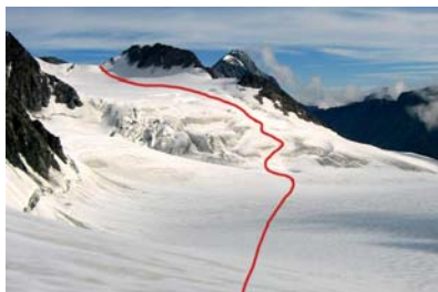
Bod 7.: ledovec Mensu, pohled zpátky. Nahoře je Delane pass.