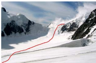
Bod 7.: ledovec Mensu, nahoře je Berel camp

Výstup do sedla (6) začíná trhlinou. Potom cca 250 metrů lezení v ledu na vrchol. Klienti horských vůdců to mají na levé straně vyfixovaný. Je nutnost mít nějaké zkušenosti s lezením v ledu, jištěním a šandováním. Mapa udává obtížnost 2B v Ruské stupnici. Sklon ledu je cca 50°.