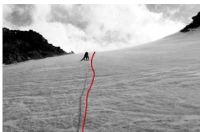
Bod 6.: v sedle Delane pass

Čelo ledovce (5) je vidět ze stanu. Podle mapy se stále jedná o ledovec Akkem. Horští vůdce zde učí klienty lezení v ledu. Ledovec se obchází zprava, jde to i přímo přes něj, ale je to zbytečný. Po chvíli se na něj zprava stejně přejde a jde se až nakonec, pod sedlo Delane pass (6). Poslední možnost nabrat vodu. Je to zase klasická ledovcová destilka bez minerálů.