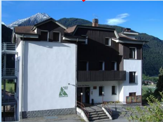
Casa del parco